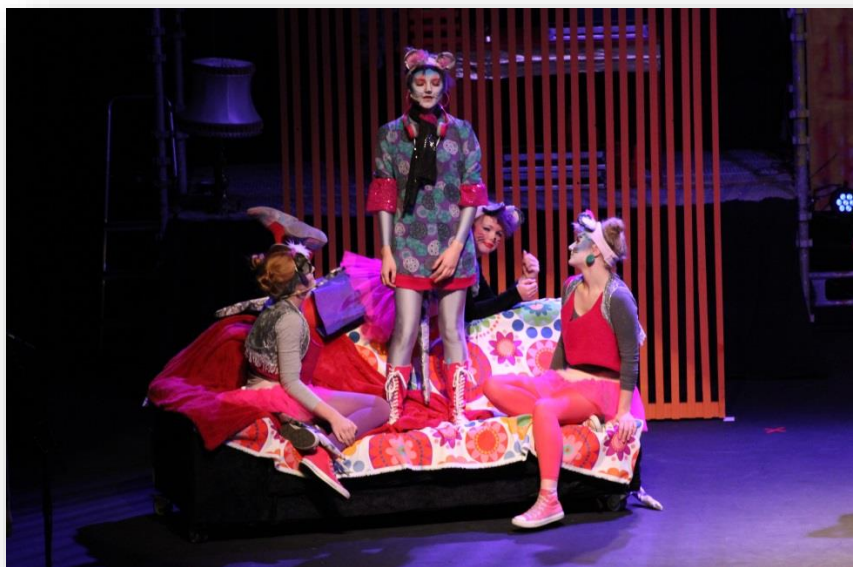
Fra Heavykatten