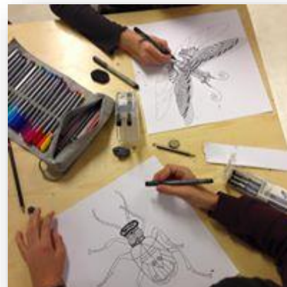
Under arbeid