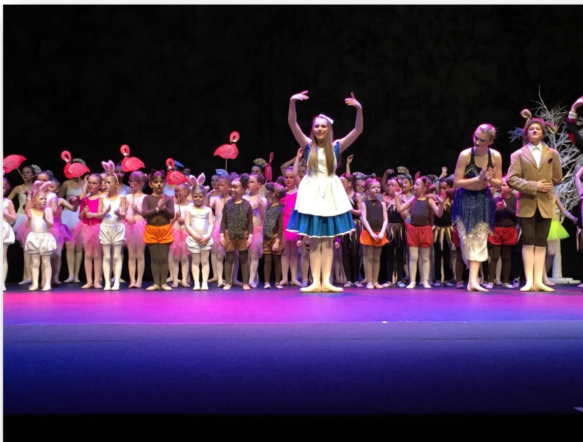
Fra Alice i eventyrland