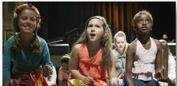
DUF i Logen