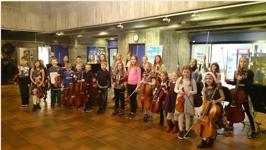
Orkester Stord kulturskule